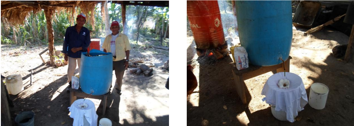
Figura 1. Colaboración de los Sres. Contreras en la elaboración del aguardiente.

Contreras, quienes colaboraron en la documentación del proceso para producir el aguardiente de caña de azúcar y maíz, como se observa en la Figura 1.